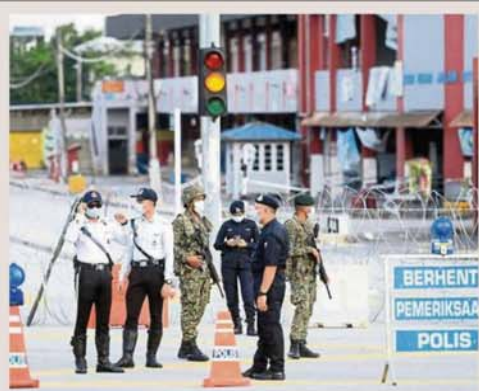
Police and army personnel guarding a blocked-off part of Jalan Othman in Petaling Jaya Old Town.

Provided for client's internal research purposes only. May not be further copied, distributed, sold or published in any form without the prior consent of the copyright owner.