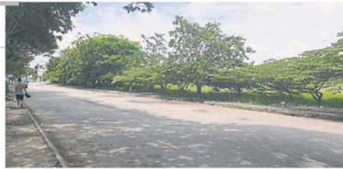
武吉丁宜流动小贩经营地点空无一档。

全面复工或引发另一波 2019 冠状病毒病疫情, 为此, 于 3 日推出修正有条件行动管控令, 当中便指示地方政府拟定一套标准作业程序后, 才能允许流动小贩和餐车重