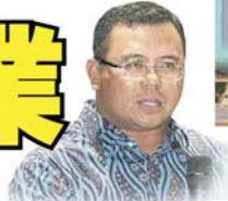
■阿末魯丁：露天巴刹和夜市，暫時不能開業。