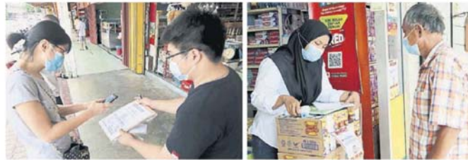
■业者只需要下载和复印本身的二维码，便可以让顾客轻松扫描。 ■一些顾客不会扫描，店员耐心讲解。