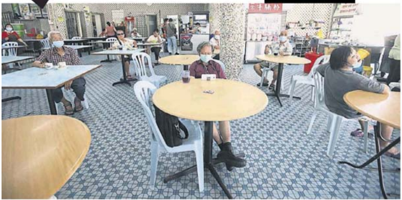
■允許放置在五腳基或泊車位上。（檔案照） ■餐館允許提供堂食，不過桌椅必須保持社交距離，以及不