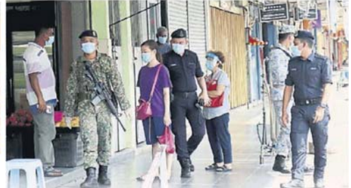
■军警继续在商业区巡逻，确保商家和顾客遵守管制令。