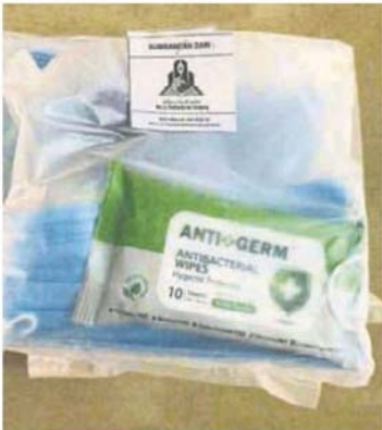
■ 愛心健康包內裝有搓手液、消毒紙巾及口罩。