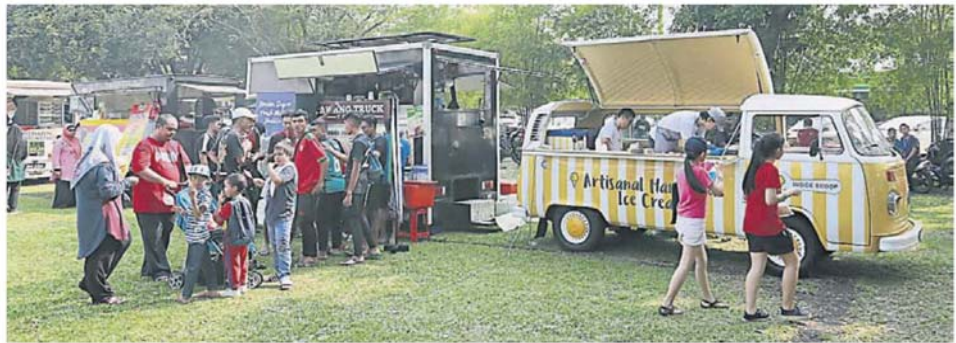
雪州政府允许流动餐车和路边食摊恢复营业, 但仅限得来速、打包和外卖。(档案照)

“另外, 早市和夜市仍禁止营业; 相对, 公共巴士、批发巴士、新鲜巴士和私人巴士则或准进行一切常规营业活动, 惟, 仍不可展开宰割或屠宰作业, 如宰杀鸡只。”