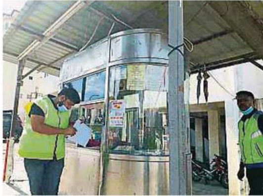
永安鎮彩虹苑公寓在守衛亭貼上二維碼，供訪客、承包商和電召車司機進入時扫码登記。

Provided for client's internal research purposes only. May not be further copied, distributed, sold or published in any form without the prior consent of the copyright owner.