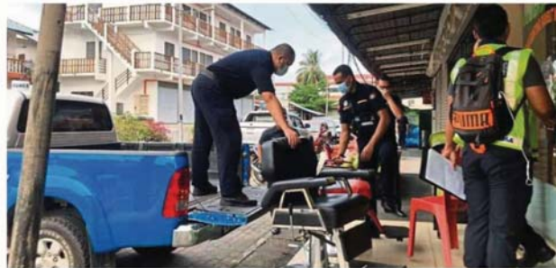
MBSA enforcement officers closing down one of the five business premises for violating rules.

Shahrin also reminded the public to obey the conditional movement control order rules and regulations set by the city council. — By BRENDA CH'NG