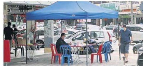
■警方在商业区搭棚驻守，方便展开监督工作。

商家只需要登入官网 selangkah.mbiselangor.com.my 或 selangkah.my ，下载属于本身的二维码，即可开始使用该系统。