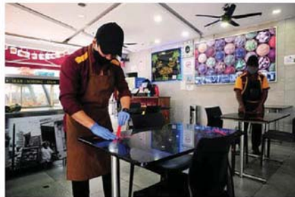
雪州的所有餐馆和食肆从13日(本周三)开始获准开放堂食。

2)餐车和路边摊-任何没有建筑物的路边摊和餐车获准从上午8时至晚上10时营业,惟只限免下车领餐、打包和送餐服务,禁止堂食。