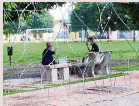
Residents discussing their predicament on discovering total restriction of movement in Petaling Jaya Old Town on Sunday morning.

The move came following 26 positive cases detected in the area.