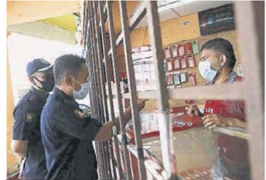
■ 莎阿南市政厅在梳邦新村大街总共查封了14间店连，是由外劳经营。