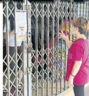
■一些商店隔著铁闸做生意，顾客只能告诉业者要买的东西。