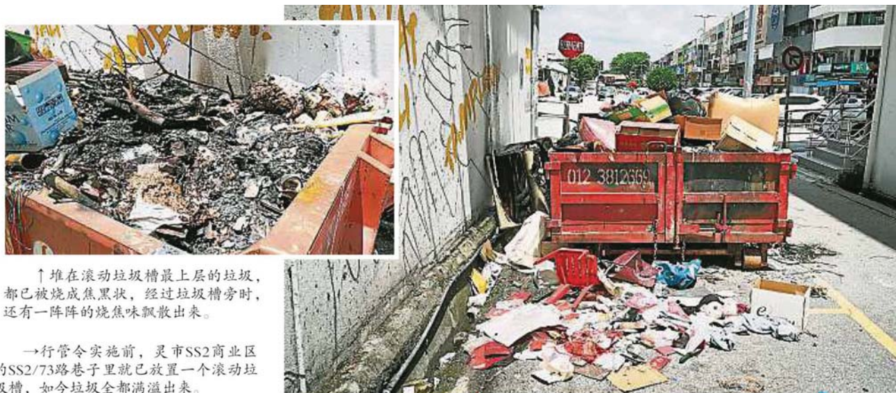
↑ 堆在滚动垃圾槽最上层的垃圾， 都已被烧成焦黑状，经过垃圾槽旁时， 还有一阵阵的烧焦味飘散出来。

Provided for client's internal research purposes only. May not be further copied, distributed, sold or published in any form without the prior consent of the copyright owner.