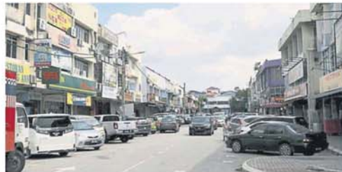
永安镇早市仍被禁止营业, 惟商贩希望当局早日解封。

除此, 巴生多数餐车业者皆被安排在公园停车位及空地经营, 由于公园禁止开放, 或也影响他们在有关地点的经营。